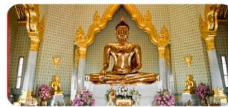
Chùa Phật vàng 5,5 tấn