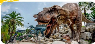
Công viên khủng long Nong Nooch