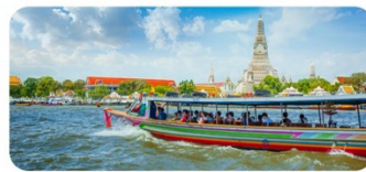
Dạo thuyền sông Chaophraya