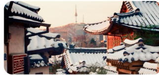
Làng cổ Bukchon Hanok