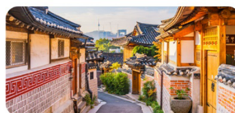
Làng cổ Bukchon Hanok