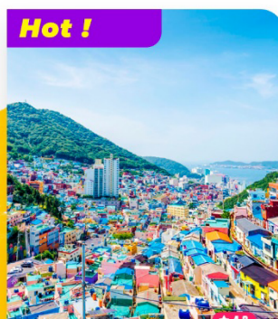
Hot ! Khám phá Làng bích họa Gamcheon