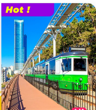
Hot ! Trải nghiệm Tàu lửa ven biển Haeundae