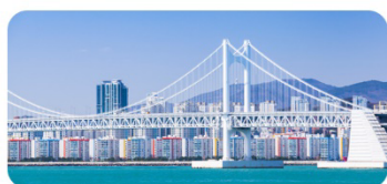
Cầu treo Gwangan