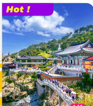
Hot ! Tham quan Chùa Haedong Yonggungsa