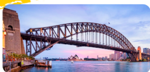
Sydney Harbour Bridge