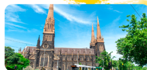
Nhà thờ Thánh Patrick