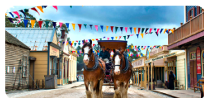
Thị trấn Ballarat