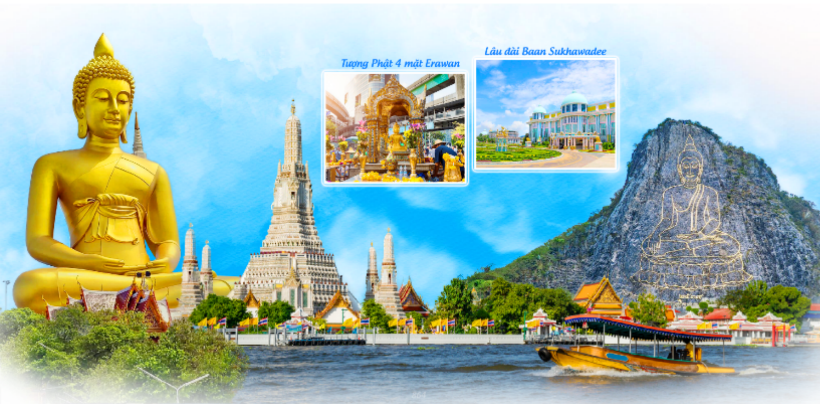
Tượng Phật 4 mặt Erawan