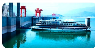
Âu Tàu Cát Châu Báu