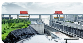
Đập Tam Hiệp